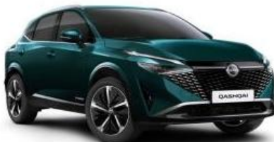
DEEP OCEAN (FAP)