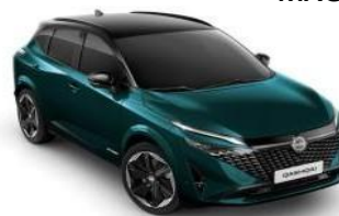
DEEP OCEAN / ЦРН КРОВ (YBJ)