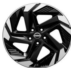
18" АЛУМИНИУМСКИ ФЕЛНИ