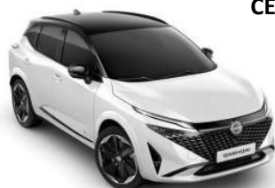
БИСЕРНА БЕЛА / ЦРН КРОВ (XKJ)