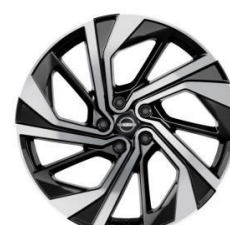
20" АЛУМИНИУМСКИ ФЕЛНИ