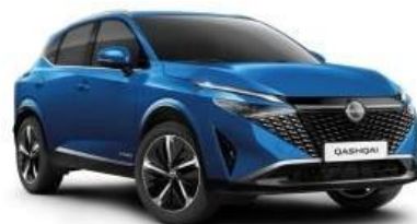
MAGNETIC СИНА (RCF)