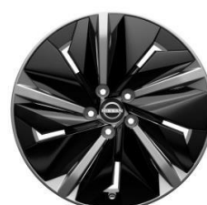
19" АЛУМИНИУМСКИ ФЕЛНИ