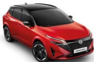
FUJI SUNSET / ЦРН КРОВ (YAU)