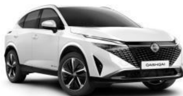
БИСЕРНА БЕЛА (QBE)