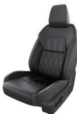
НАРПА КОЖНИ СЕДИШТА (Z)