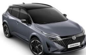
CERAMIC СИВА / ЦРН КРОВ (XEX)