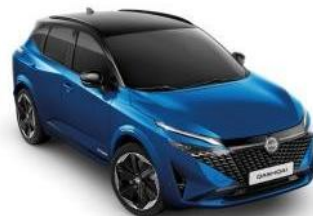
MAGNETIC СИНА / ЦРН КРОВ (XGZ)