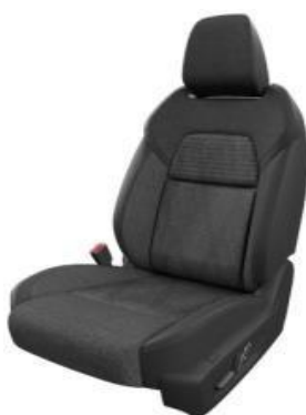
НАВЛАКИ ВО КОМБИНАЦИЈА НА ЦРНА ТКАЕНИНА И ЕКО КОЖА (G)