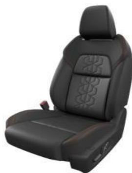
НАВЛАКИ ВО ЦРНА ЕКО КОЖА (H)