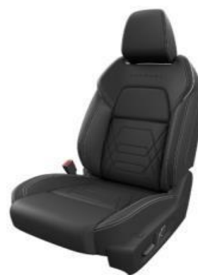
НАВЛАКИ ВО КОМБИНАЦИЈА НА ЦРНИ ШЕВОВИ И КОЖА ALCANTARE (Z)