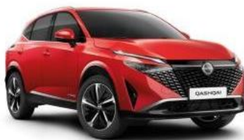
FUJI SUNSET (NBV)