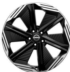
20" АЛУМИНИУМСКИ ФЕЛНИ N-DESIGN