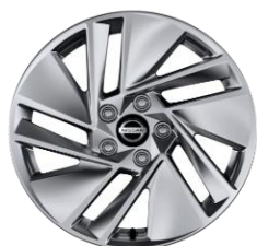
17" АЛУМИНИУМСКИ ФЕЛНИ