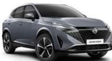
CERAMIC СИВА (KBY)